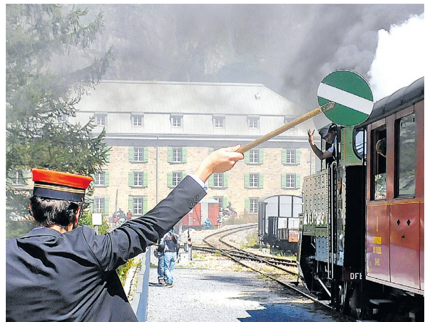
Bahnstation Gletsch, im Hintergrund das Blaue Haus. Die Kommunikation zwischen Stationsvorsteher und Lokführer klappt: Abfahrt Richtung Realp.